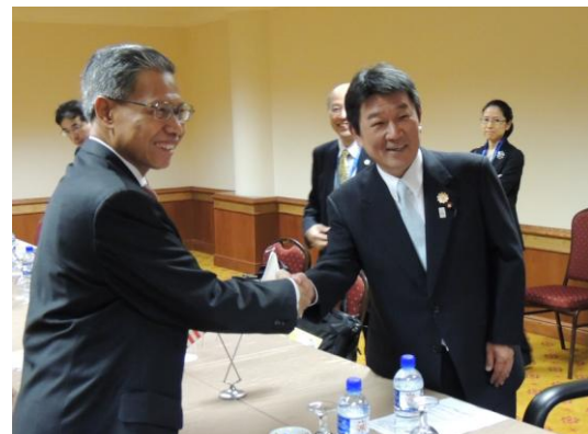
マレーシア・ムスタパ 国際貿易・産業大臣との会談