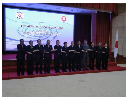
日 ASEAN 経済大臣会合