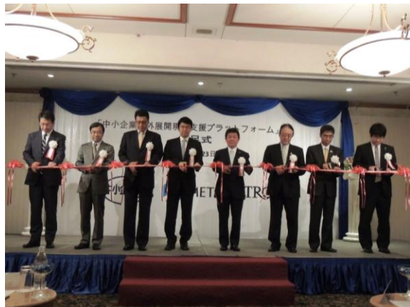
中小企業海外展開現地支援 プラットフォーム発足式