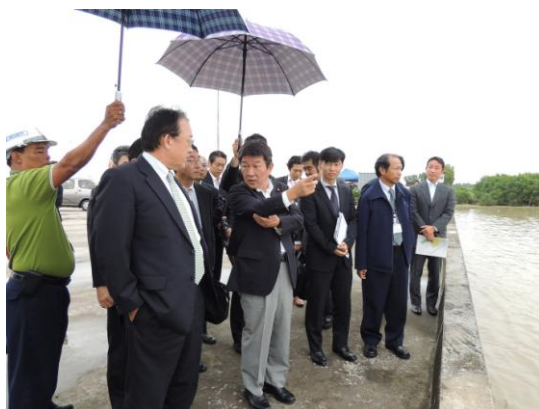
ティラワ経済特区の視察