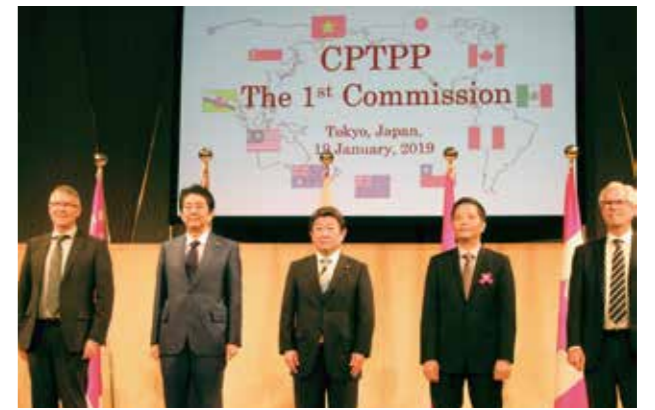
2019年1月 第1回TPP委員会で11か国の代表と

今年の干支はイノシシ。十二支の最後、締めくくりの年となります。猪を表す干支の漢字「亥」は「とじる」という意味で、生物が枯れ、新たな生命力が種子の中に宿る様子を表しています。まさに平成という時代が終わり、新しい年号となるこの年を、新しい時代、新たな飛躍に向けてスタートするよい一年にしたいと思います。