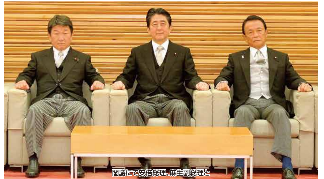
閣議にて安倍総理、麻生副総理と

■ホームページ: http://www.motegi.gr.jp ■E-mail: toshimitsu@motegi.gr.jp ■発行所: 自由民主党栃木県第5選挙区支部