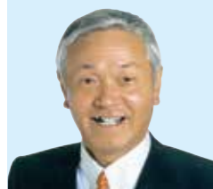
木村 好文 現職7期(公認) 自民党栃木県連幹事長