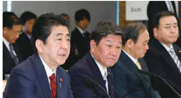
2018年4月 未来投資会議

こうした成果の上に、今年は、日本経済が直面する大きな課題、3つの壁に全力で取り組む1年にしたいと思います。