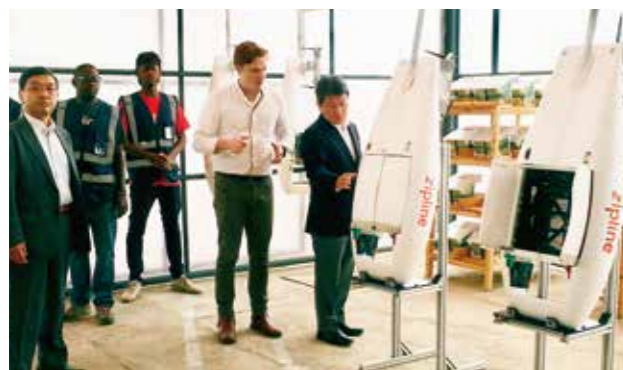
2018年8月 アフリカ・ルワンダにて最先端の技術導入の現地視察

2つ目は、経済成長と財政健全化の両立です。10月1日には消費税率の引上げを予定しています。これは、財政の健全化だけでなく、教育無償化や社会保障の充実・安定化に不可欠なものです。引上げに伴って景気の回復力が弱まってしまうことがないように、駆け込み需要と反動減の平準化や、家計、中小・小規模事業者への支援など、あらゆる施策を総動員して万全の対応をしたいと思います。