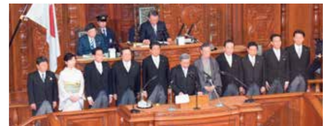
2018年5月 国会にて永年在職25年表彰(写真の一番左側)

この1年間、私の担当する政策分野では、幼児教育・高等教育の無償化を一気に進め、成長戦略でも、人工知能、ロボット、車の自動走行など第4次産業革命の技術