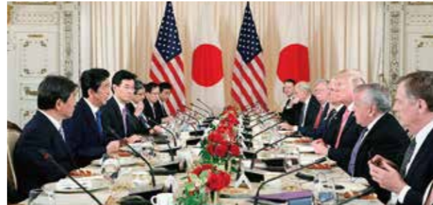
2018年4月 安倍総理、トランプ大統領の日米首脳会談に同席

3つ目の壁は、通商問題と海外経済のリスクです。今、世界で保護主義の動きが広がり、米中対立など深刻な通商問題が起こっています。TPPの拡大や日米通商協議などを通じ、日本が主導して、自由貿易システムを守っていかなければなりません。