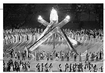
2/28 バンクーバーオリンピック閉会式