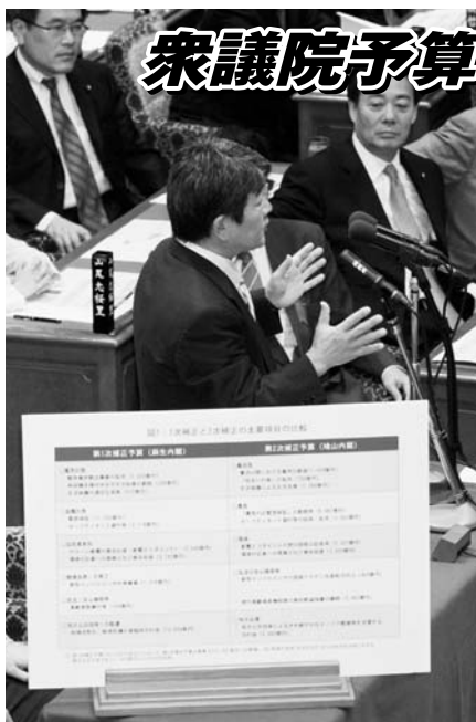
委員会の質疑では大型パネルを使い 予算案の問題点を厳しく追求