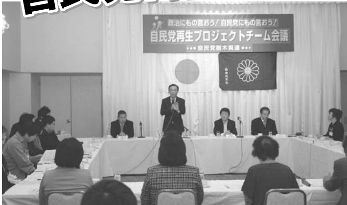
H21.10/10 谷垣総裁を迎え、党再生プロジェクトチーム始動