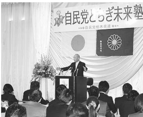
2/2 とちぎ未来塾開講式にて舩添要一塾長の講演

2月20日に舩添要一参議院議員を塾長に迎え、41名の塾生が参加して「自民党とちぎ未来塾」が開講しました。新しい日本を創っていかうという熱意に満ちた塾生たちに舩添塾長より、「あらゆる政策に精通したオールラウンドプレイヤーになって欲しい」との激励の言葉を頂きました。全10回の講座を通して、塾生たちが日本の未来に対する明確なビジョンを掲げ、この国や地域が抱える問題と真剣に向き合って政治を担っていくリーダーとなるよう、私達はこの未来塾での人材育成に全力を注いでいきます。