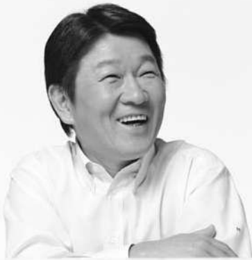
衆議院議員 茂木 敏 充

一日も早い景気の回復に向け、私が「日本経済再生戦略会議」幹事長としてとりまとめにあたった緊急経済対策が次々と動き出し、製造業の景況感が2年半ぶりに改善、自動車、省エネ家電の売り上げが大きく伸びるなど、その効果が徐々にあらわれつつあります。