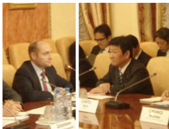
(ガルシュカ極東発展大臣と会談)