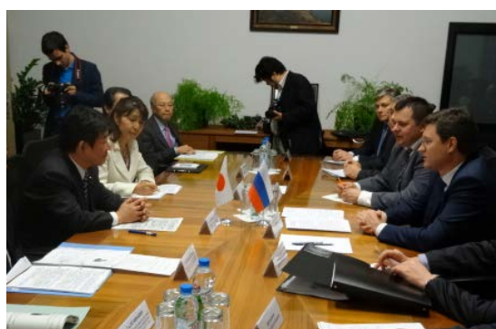
(ノヴァク・エネルギー大臣と会談)