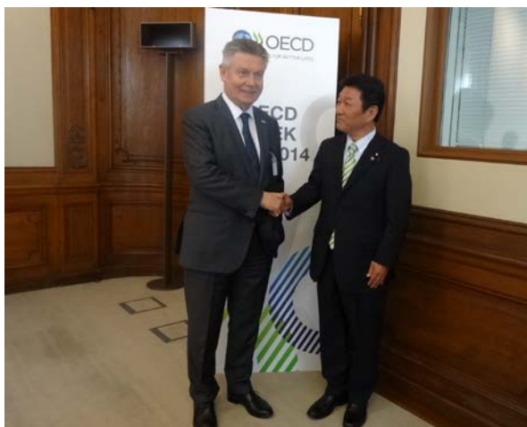
デ・ヒュフト欧州委員との会談