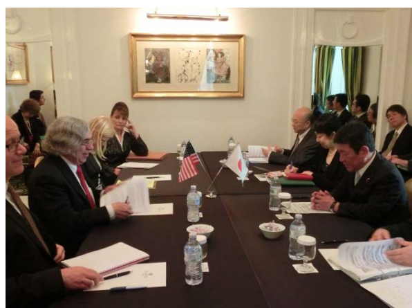
モニーツ 米国エネルギー省長官との会談