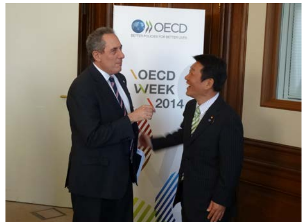
フロマン米国通商代表との会談