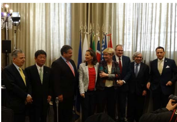
G7 エネルギー大臣会合

なお、リックフォード大臣は、川崎宗則選手が所属するトロント・ブルージェイズのファンであり、一方、モニーツ大臣は、上原浩治選手が所属するボストン・レッドソックスの大ファン。両大臣との間では、日本人選手の北米での活躍の話題で盛り上がり、和やかな雰囲気の中で会談が行われました。リックフォード大臣からは、ハーバード大出身の私がどのチームのファンか問われましたが、「国家秘密である。」と回答しました。