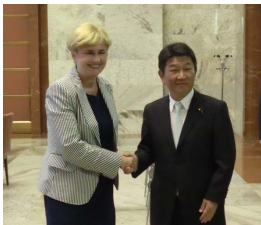
ガイディ イタリア経済振興大臣との会談