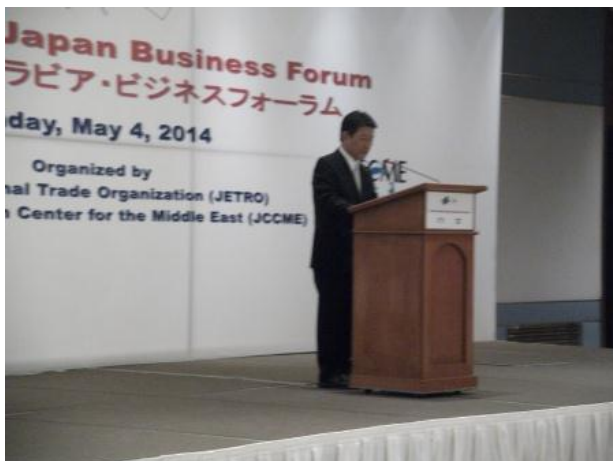
ビジネスフォーラムでのスピーチ