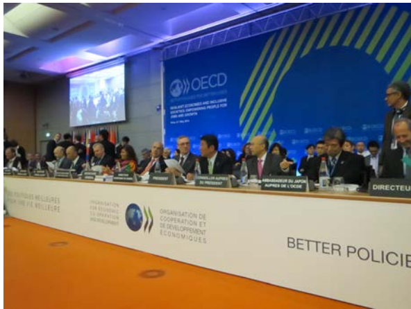
OECD 閣僚理事会 貿易セッション