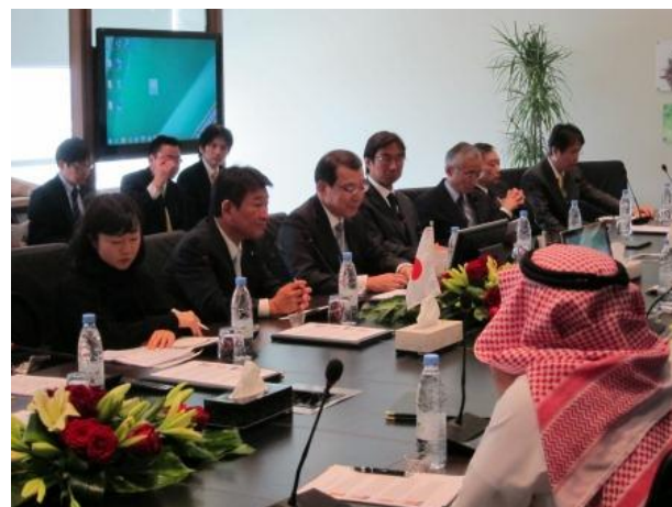
アブドルアジズ石油鉱物副大臣とのバイ会談