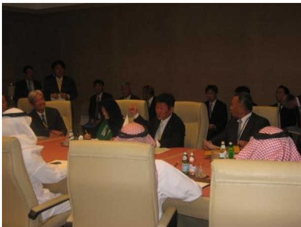
タウフィーク商工大臣とのバイ会談