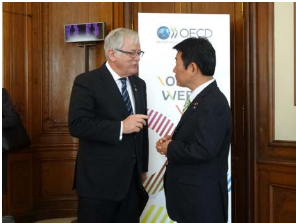
ロブ豪州貿易大臣との会談